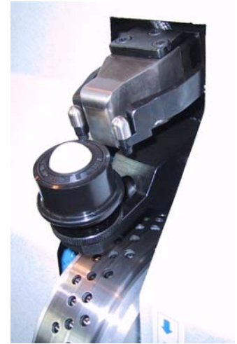
Beheiztes Hammerwerkzeug Hammer tool is heated