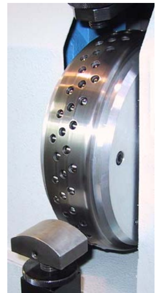
Kugelwalze mit Auflage Ball roller with support