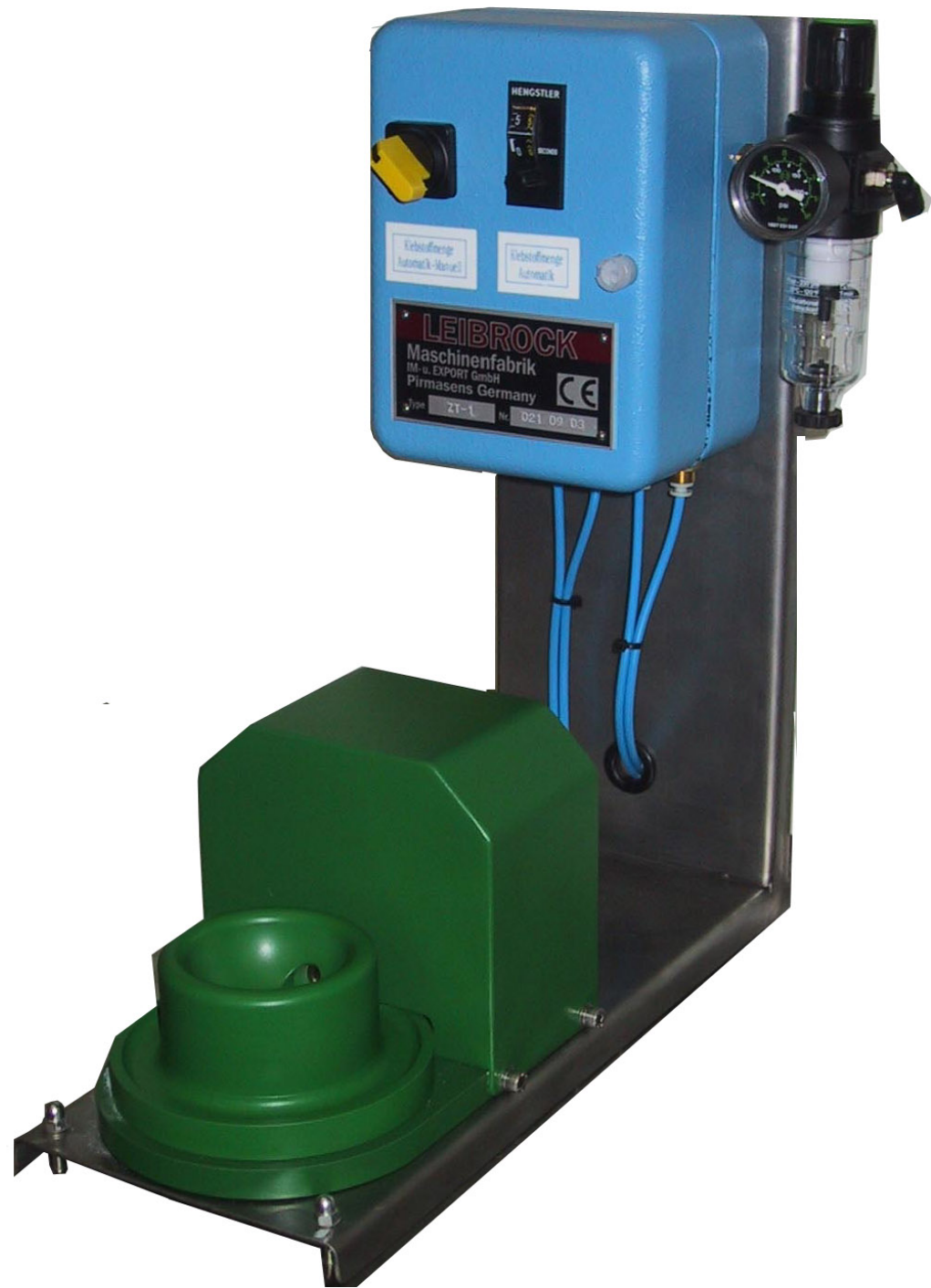
Klebstoff Topf cement vessel Modell ZT 1