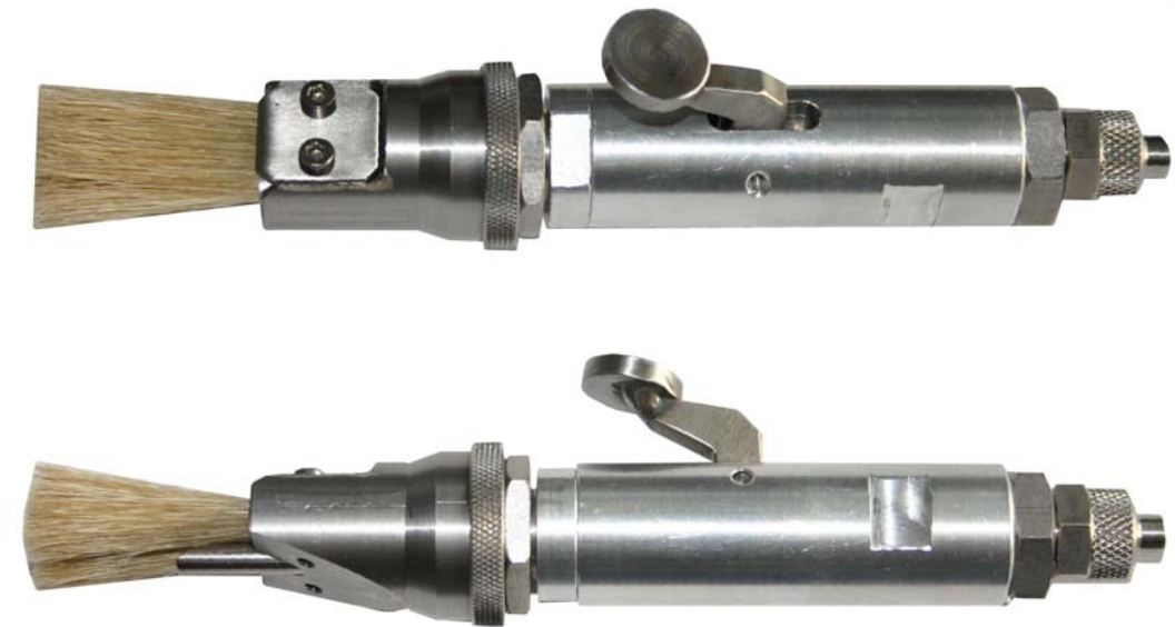
Klebstoff Pistole Glue pistol Modell P2